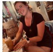
Dorien Coordinator van het project